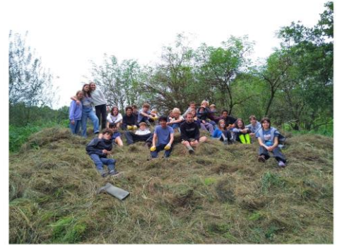
Educatief natuurbeheer Doode bemde

Klassen die zich inschrijven voor deze activiteit hebben recht op een gratis begeleide wandeling in de Doode Bemde (zie 11). Het natuurbeheer en de wandeling kunnen aldus gecombineerd worden tot een dagvullend programma (voor- en namiddag).